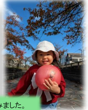
紅葉を見ながら、ボールやシャボン玉も楽しみました。