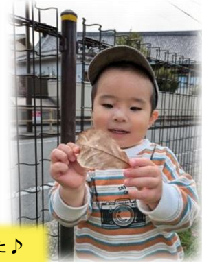
お気に入りの落ち葉、みつけた♪